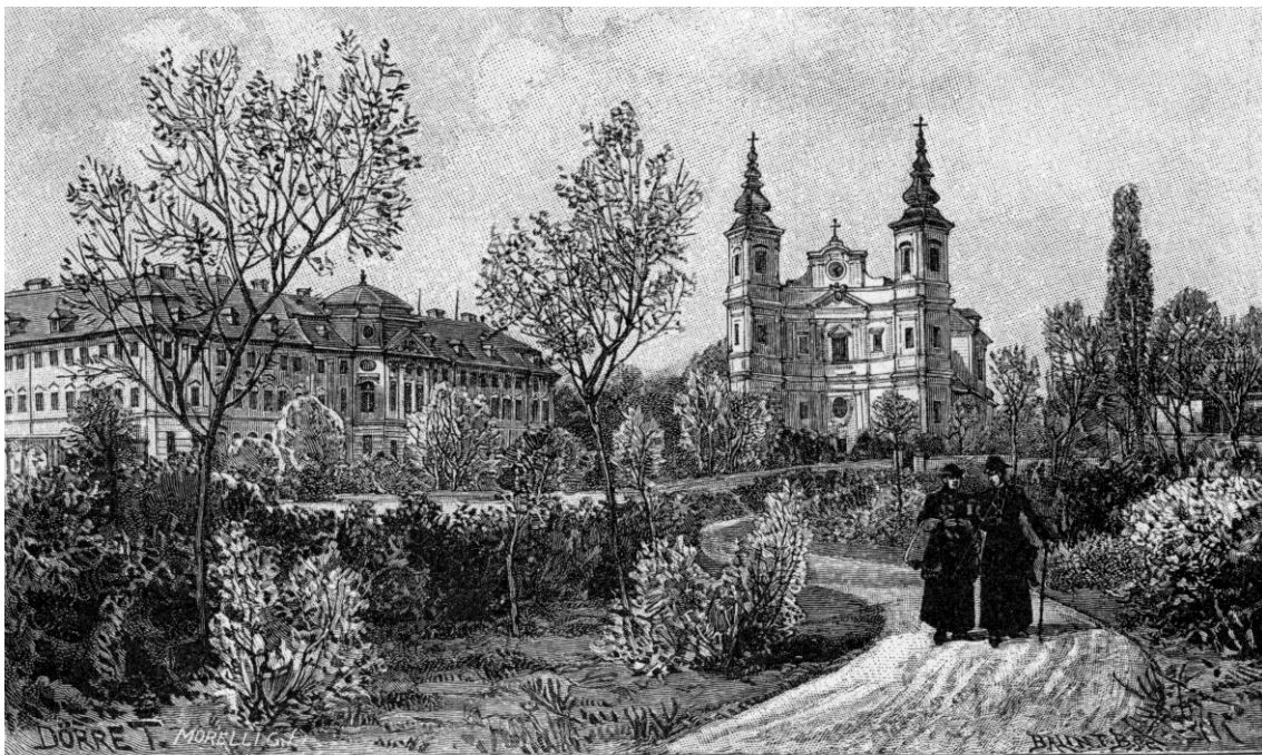
A nagyváradai római katolikus székesegyház és püspöki palota.

A század végén Bunyitay így írt a város korai fejlődéséről: „Nagyobb lendületet adott a város alakulásának gr. Forgách Pál püspök, ki a mai székesegyház és püspöki palota, valamint az úgy nevezett Káptalansor alapjait vetette meg (1752), és pedig nem kevesebb merészséggel, mint genialitással, kívül a városon, de szép és téres magaslaton. Csatlakoztak hozzá a nemes munkára a káptalan tagjai, jelentékeny áldozatokat téve a város jövője érdekében. Gyöngyösy György, Istvánnak, a költőnek családjából, kórházat alapított az Irgalmas-rendűek vezetése alatt; Szenczy István klastromot épített az Orsolya-apáczáknak s abban leányiskolát nyitott; Csik-Rákosi Salamon József árvaházat, Alapy János konviktust állított föl. A szerzetesrendek közül is a premontreiek, pálosok, ferenczesek, jezsuiták, kapuczinusok új klastromok, egyházak, iskolák építéséhez fogtak, de nem a régiek helyén, mert azok legtöbbjének még nyoma sem maradt fenn. A kihalt város ereibe vissza kezdett térni az élet. A hajdani országos hírvű váradi vásárok, melyeknek mindegyike két hétig tartott és Brassó kereskedőivel összehozta a gömöri vashámorosokat és Pestnek, Pozsonynak divatczikk-árúsait, ismét megújultak, s a régiéknél nem kisebb látogatottságnak örvendtek.”