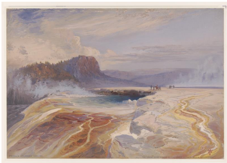
Great Blue Spring (Thomas Moran)