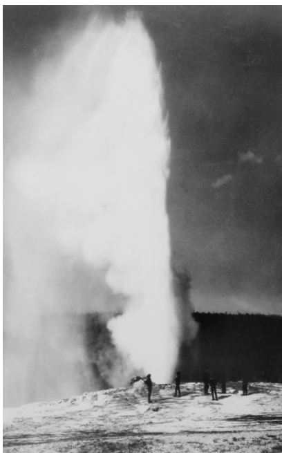
A legelső fényképfelvétel az Öreg Hűségéről