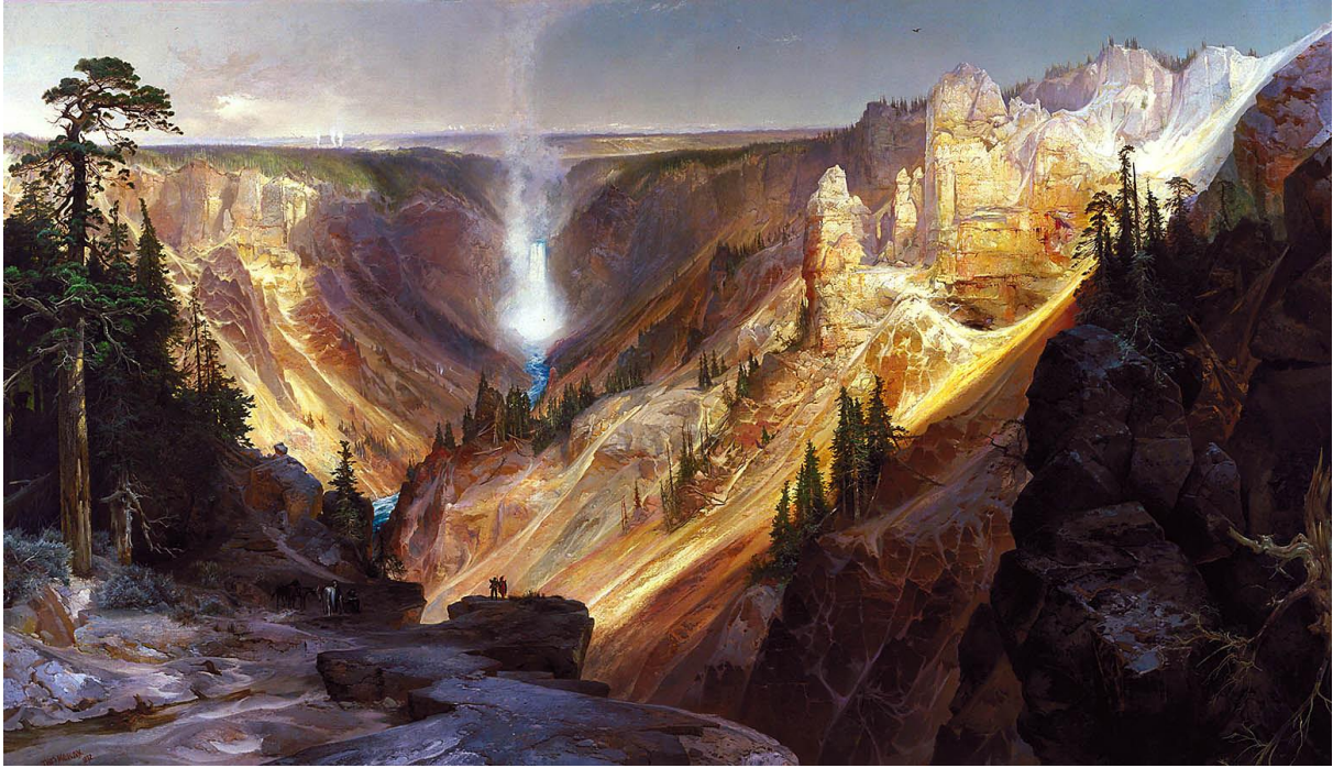
A Yellowstone-vízesés (Thomas Moran festménye)

Expedíciójának tagjai között volt két botanikus, egy meteorológus, egy zoológus, egy ornitológus, egy entomológus, egy mineralógus, egy térképész, továbbá egy művész és egy fényképész. Thomas Moran utazás alatt készített festményei és William H. Jackson fényképei, a részletes térképek, valamint Hayden 500 oldalas, átfogó beszámolója erősen hozzájárult ahhoz, hogy az amerikai Kongresszus a régiót 1872. március 1-én kivonta az elárverezendő területek közül és Ulysses S. Grant, az USA 18. elnöke aláírta a Yellowstone Nemzeti Park létrehozásáról szóló törvényt.