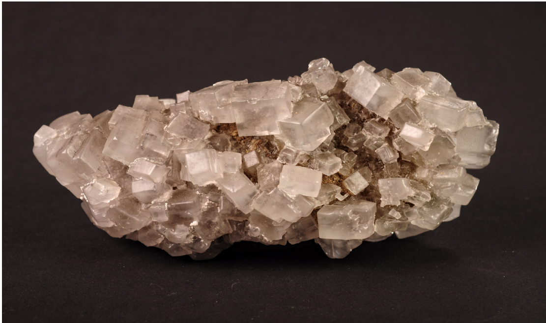
Szabályos, áttetsző kősókockák a Magyar Bányászati és Földtani Szolgálat gyűjteményéből. Lelőhely: Marosújvár

Az Erdélyi-medencét harmadidőszaki üledékek töltik ki. Ezekben található az 500 méteres vastagságot is meghaladó, kősótelepeket tartalmazó rétegek. Mivel a kősó plasztikus, emiatt a lerakódott kősórétegek a szerkezeti mozgások során lassan kinyomódtak a medence szélei felé. A kősóösszlet a vetők mentén felfelé nyomult és a fedő kőzeteket áttörve sótömzsöket alkot. A jellegzetes diapírok és sódómok a medence szélén a felszínen vagy alig 2–300 méteres mélységben találhatóak – a területen ötvennél is több külszíni előfordulás ismert.