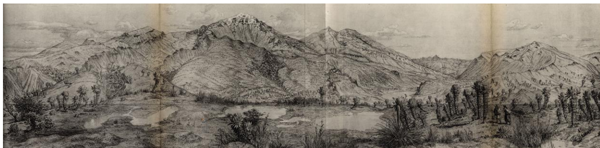
A Chiles-vulkán és a Cerro Negro de Mayasquer déli oldala

A Magyar Bányászati és Földtani Szolgálat Földtani Szakkönyvtárának raktárában számtalan „kincs” lapul és vár arra, hogy akár több évtizednyi csendes pihenés után újra kézbe vegye valaki. Ilyen kötet valószínűleg Alphons Stübel Kolumbia vulkánjai című könyve is, amely két térképen és számos gyönyörű metszeten mutatja be e máig nehezen elérhető ország csodás tájait.