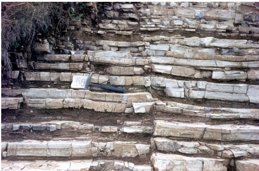
Felsőörsi Mészkö az aszófői Farkó-kő alapszelvényében

„ Nincs még egy olyan tája hazánknak, amelynek meg-megújuló és mindig újat hozó földtani kutatása ily szorosan összekapcsolódott volna a földtan tudományának hazai fejlődésével. Ebben szerepe van a tájegység változatos földtani felépítésének, üledékes képződményei faunagazdagságának – és nem utolsósorban – a tájképi szépségeknél ” – írta a térképhez tartozó magyarázókötet előszavában Brezsnyánszky Károly , a Földtani Intézet és Futó János , a Bakonyi Természettudományi Múzeum akkori igazgatója.