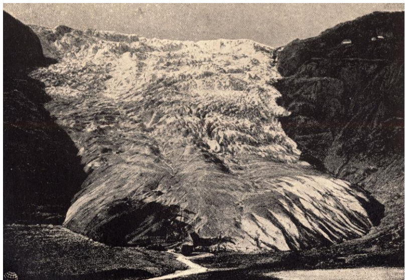
A Rhone-gleccser, a Rhone folyó forrása