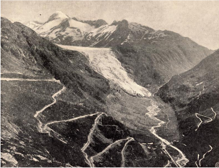
A Grimsel-hágóra vezető út. A háttérben a Rhone-gleccser és elhagyott, széles, U alakú völgye

zánk a partokról. Így a híres Tell kápolna az ősi négy kanton szabadságharcáról beszél, az Axenstrasse pedig az akadályt nem ismerő alkotásnak remeke. És az emberiség nagyságának fenséges háttérül szolgál az Alpok hólepte hegylánca, a kicsinyhitűeknek pedig a Pilatus hegye ad jóslatszerű tájékoztatást az idő fordulásáról. Ha pipál esőt jelez, ha kalapot tesz fel, jó időt jósol, de jóslásának helyességéért ő is mossa a – lábát a tó habjaiban («Hat der Pilatus einen Degen, gibt es Regen, hat er einen Hut, wird es gut!»).”