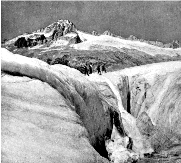
Hóhid a gleccseren, mely a glecserjárást vezető nélkül veszedelmessé teszi

Az Alpok ezen ikonikus gleccserének ma is kitüntetett figyelmet szentelnek. Svájci kutatók minden nyáron több kilométernyi védőtakarót helyeznek el az Alpoknak ezen egyik legidősebb ismert gleccserén, hogy fékezzék az átlaghőmérséklet fokozatos emelkedésével járó