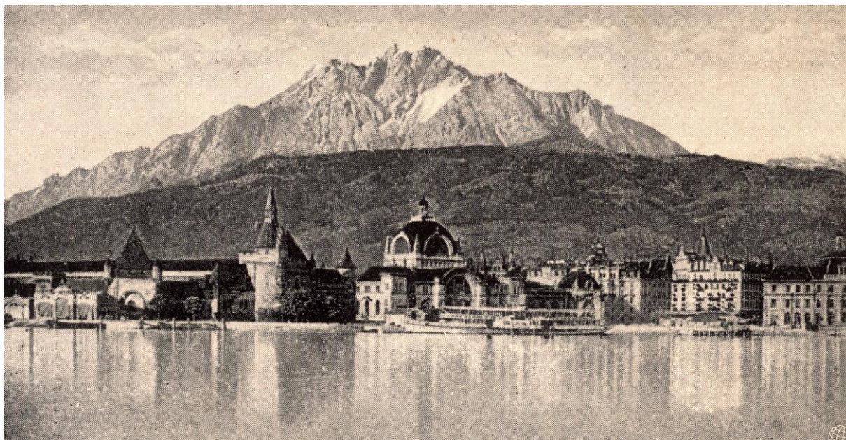
Lucern a Pilatussal, melyet időjósoknak tekintenek. Az előtérben a kupolás épület a békemúzeum

A Magyar Bányászati és Földtani Szolgálat Térképtárának gyűjteményében található egy szemgyönyörködtető térképsorozat az 1880-as évekből, amely az Alpok földtani felépítését mutatja be 1:100 000-es méretarányban. A cikkben közölt térkép Entlebuch környékét mutatja, amely 2001 szeptembere óta az UNESCO Bioszféra Rezervátum hálózatának tagja.