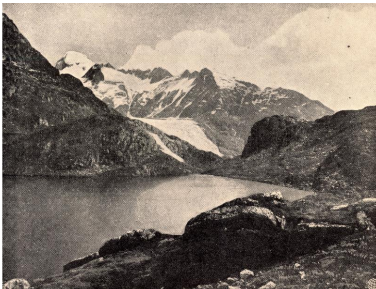
A Totensee a Grimsel-hágón. Jellegetes tengerszem, mely gleccser vájta kis üstben ül a magas bércek között

Meiringenig ázunk, fázunk, aztán vonaton átvágunk a hegyeken, szárazba öltözve megújodottan, jókedvűen gyönyörködünk a Lungern és Sarnen tavacskában, majd elérjük Alpnachstattnál az ősi Schweiz gyöngyét a Vierwaldstätter tavat, melynek partján minden rög Tell Vilmos regés alakjáról beszél. Maga a tó még a közönséges turistát is lebilincseli a benyomásoknak remek szárnyalásával a fenséges felé. Lelkes szavakban ad ennek kifejezést Heer, Schweiz monografiájában: «Luzerntől Flüelenig a tavon tett úton a benyomások egyre fokozódnak, valósággal olyan szimfóniát alkotnak, mely kecses Allegróval kezdődik és ünnepélyes